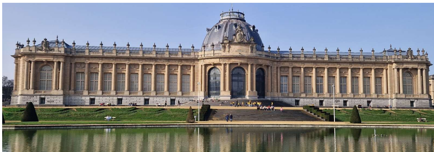
Het Koninklijk Museum voor Midden-Afrika. Sinds 2018 Het Africa Museum

Tervuren wordt bewoond door Nederlandstaligen, met een aanzienlijke franstalige minderheid. Tevens kent Tervuren minderheden uit velerlei landen, waaronder Britten en Amerikanen, die onder andere worden aangetrokken door de “British School of Brussels”, die in de gemeente gevestigd is. Veel buitenlanders werken hier tijdelijk voor internationale bedrijven en organisaties.