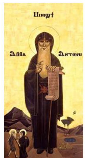
Antonius van Egypte