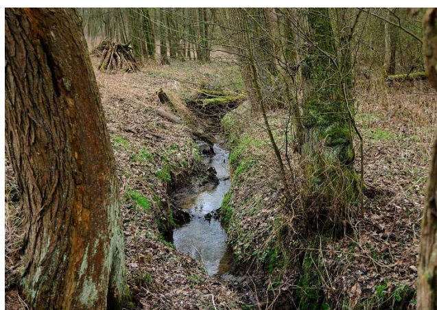
De Broekbeek in Asse