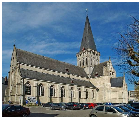
De Sint-Martinuskerk Asse