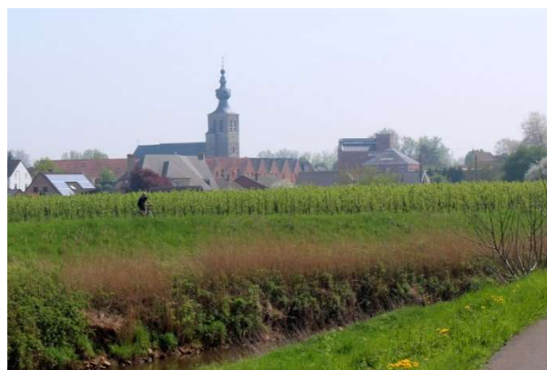
Een zicht op de gemeente Werchter

Werchter was een zelfstandige gemeente tot aan de gemeentelijke herinrichting In 1977.