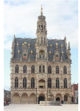
Het stadhuis >>

Oudenaarde is een stad in de Belgische provincie Oost-Vlaanderen. De stad ligt 30 km ten zuiden van Gent en telt ruim 32.000 inwoners, die Oudenaardenaren of Oudenaardisten worden genoemd. Eertijds was de stad in heel Europa bekend om haar wandtapijtenproductie, een nijverheid die haar bloeiperiode meemaakte in de zestiende eeuw, maar nog bleef voortduren tot in de achttiende eeuw. Vandaag wordt de stad weleens de parel van de Vlaamse Ardennen genoemd.