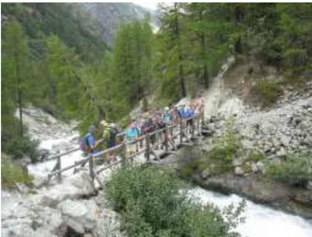
(3) Plat de la Lé