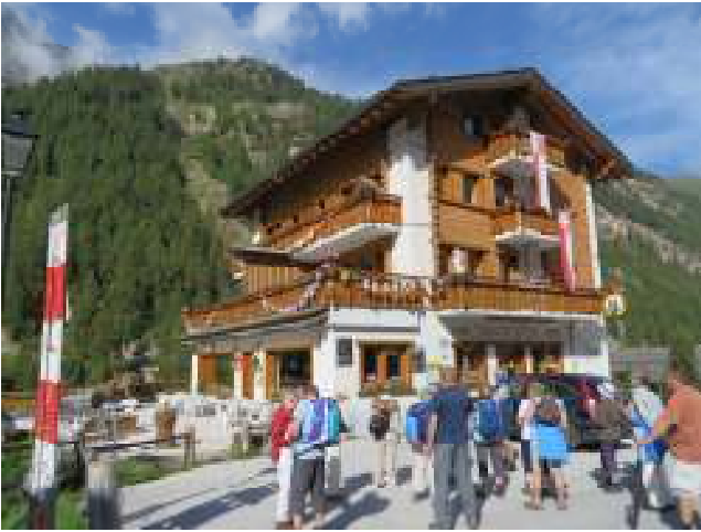
(1) Dorpsverkenning, de begeleiders vertellen over de omgeving, zodat je je kan oriënteren, + enkele weetjes over het dorp.

Laten we beginnen met de makkelijke: tussen haakjes, de fysiek minst zware.