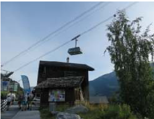
(5) Eerst met een kabelbaan naar boven, dan een wandeling naar de corne de Sorebois