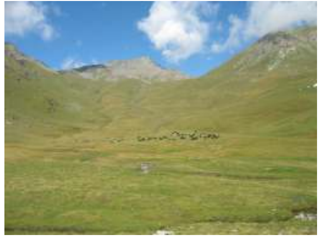
(2) Langs de Navisence wandelen we door een wijde vallei tot waar de alpenweiden beginnen.