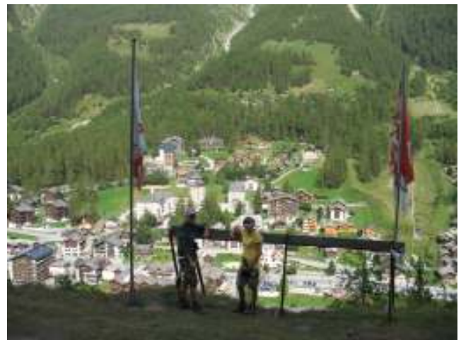
(4) Cascade de Volermo & uitzichtpunt dorp